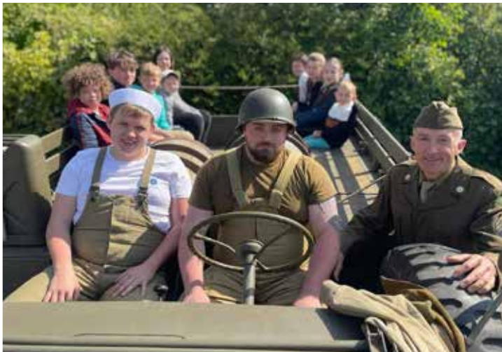
Les enfants du CME dans un des véhicules militaire (DODGE)

A l'issue de la cérémonie, une remise de diplômes a honoré 3 jeunes porte-drapeaux Plédranais. Ensuite les enfants du CME ont pu apprécier de monter dans les véhicules anciens et de faire un tour dans les rues principales de Plédran..