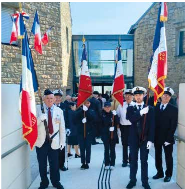
Porte-drapeaux avant le défilé

Depuis 79 ans, nous ne l'avons pas oubliée. Pour toujours, elle nous anime. »