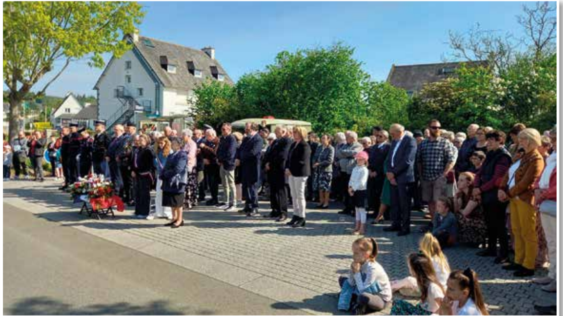
Population nombreuse sur le parvis du monument aux Morts