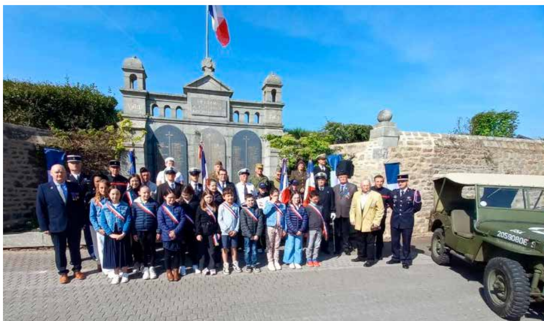
Le Maire entouré des membres du CME, des présidents d'associations patriotiques, de la Gendarmerie et des pompiers.